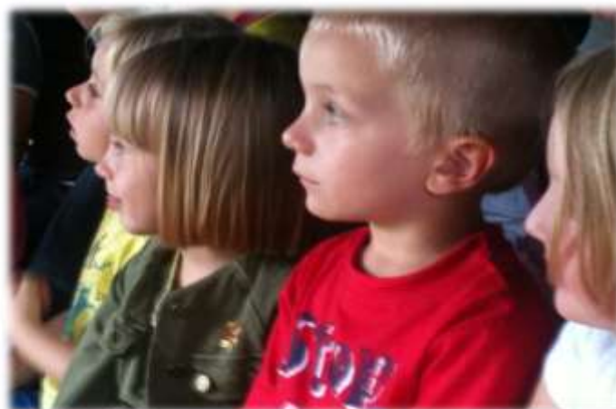
Trop mignons les petits au spectacle du périscolaire

Nos deux enfants ont participé aux Nouvelles Activités Périscolaires à raison de trois fois par semaine depuis la rentrée de septembre 2014.