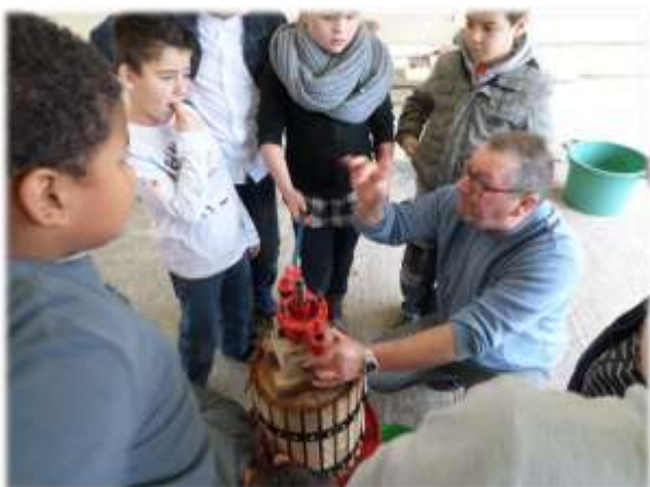
Périscolaire : Atelier « Silence ça pousse »

D'autre part, j'ai partagé quelques moments avec les bénévoles qui prennent nos enfants en activités péri scolaire, j'ai pu constater leur implication car certains ateliers demandent de la préparation à domicile, des courses, des finitions... Nos enfants se voient proposer une multitude d'activités: la fabrication d'objets en rapport avec les saisons, les évènements..., un atelier cuisine dans lequel les enfants fabriquent des recettes simples et dégustent: cookies, crêpes, roses des sables...mais aussi un atelier jardinage où les enfants ont préparé un petit jardin, construit un composteur... puis à l'automne, fabriqué un nichoir à mésanges. Bien d'autres activités ont été proposées, comme la découverte d'instruments de musique, la lecture de contes, le football, la danse, la découverte du numérique. Je remercie tous les bénévoles, la plupart extérieurs à l'école, pour leur investissement auprès de nos enfants.