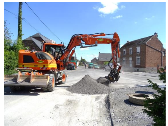
Sur la droite, la maison natale de Marc Poirette qui fut autrefois un café tenu par Rosa Poirette-Damez. Photo prise lors des travaux de réhabilitation des trottoirs de la rue du Pavé et de la rue Marc Poirette.