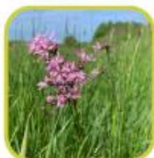
Lychnis fleur de coucou