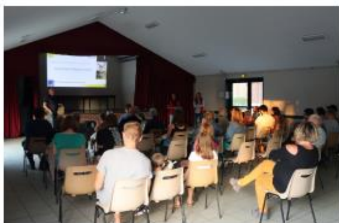
Animation "Nuit de la Chauve-souris" le samedi 27 août à Raucourt-au-Bois

Des animations scolaires seront également réalisées de novembre 2022 à mars 2023 dans 8 écoles qui ont répondu favorablement à notre proposition. Les thématiques abordées avec les élèves seront les arbres, les oiseaux des jardins et les espèces mal aimées, comme l'ortie, la ronce, la guêpe, les reptiles ou encore les araignées, selon le choix des enseignants.