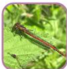
Petite nymphe au corps de feu

Pour plus d'informations sur les ABC, n'hésitez pas à contacter Manon Lavaud par mail manon.lavaud@parc-naturel-avesnois.com ou au 03.27..77.52.69.