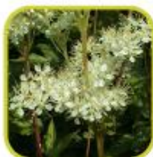
Reine des prés