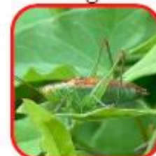
Conocéphale des roseaux