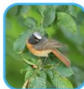
Rougequeue à front blanc