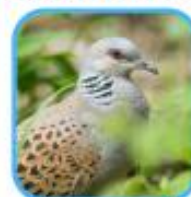
Tourterelle des bois